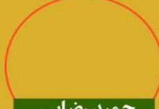
حمید رضایی رتبه ۸