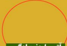
آتوسا هفت لنگی رتبه ۵