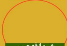
شیدا فتحی رتبه ۱۱